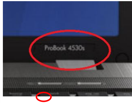
Рис. 1. Приклад використання в якості пароля назви ноутбука